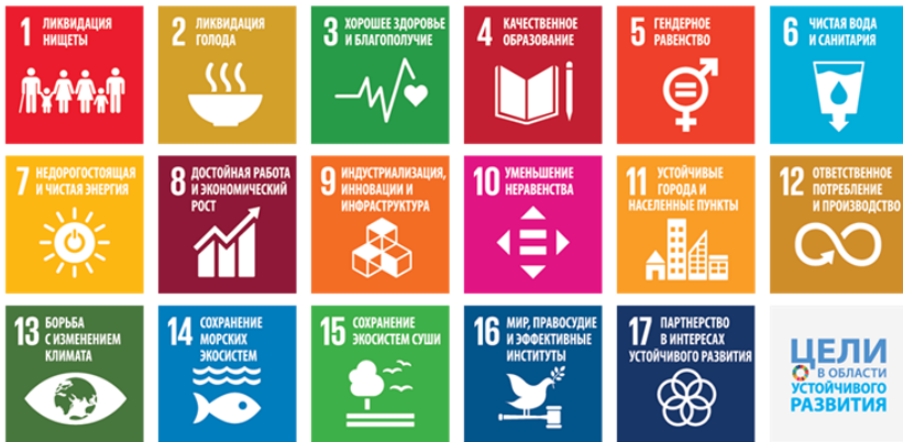
Рисунок 1. Цели устойчивого развития с иллюстрацией ООН

SDGs включают не только проблемы развивающихся стран, но и задачи любых людей в любых странах, относящиеся к ответственному поведению по отношению друг к другу, экологии, своему гражданскому долгу.