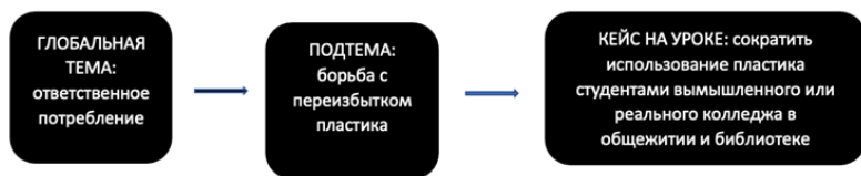
Рисунок 4. Пример создания темы кейса — 3