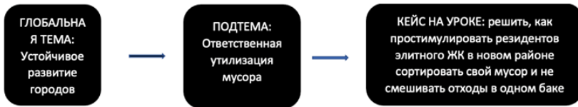
Рисунок 2. Пример создания темы кейса — 1

SDGs включают не только проблемы развивающихся стран, но и задачи любых людей в любых странах, относящиеся к ответственному поведению по отношению друг к другу, экологии, своему гражданскому долгу.