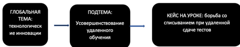
Рисунок 5. Пример создания темы кейса — 4

Из общей темы SDGs в кейсы на занятиях хорошо трансформируются темы экологии, городской инфраструктуры, ответственного потребления и переработки отходов, технологических инноваций. На базе глобальной темы выделяется подтема и строится локальная ситуация.